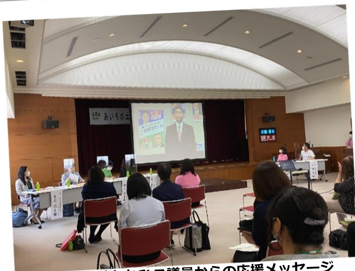
進藤かねひこ議員からの応援メッセージ