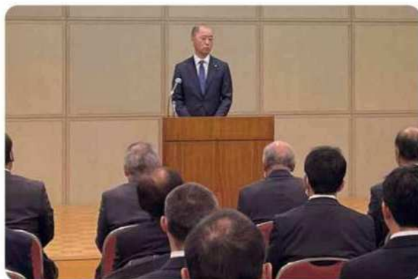
水土里ネット愛知用水