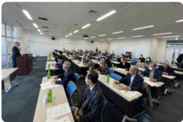
岡崎市図書館交流プラザりぶら