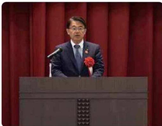
大村愛知県知事による来賓祝辞