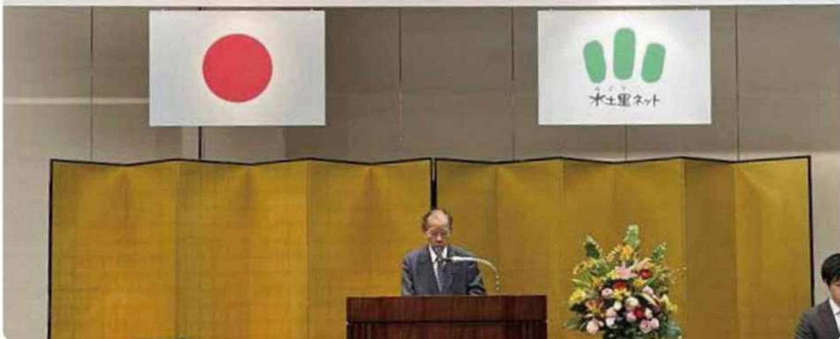
二階俊博全土連会長による挨拶