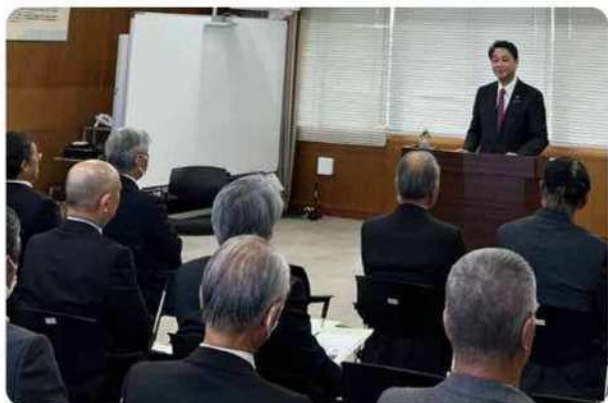
水土里ネット豊川総合用水