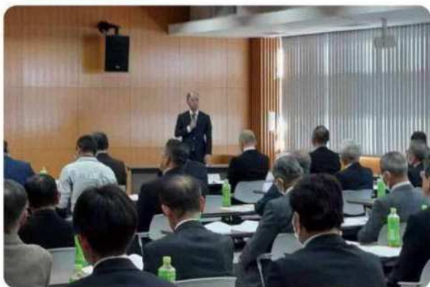
水土里ネット明治用水