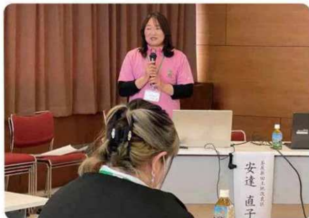
安達副会会長による講演