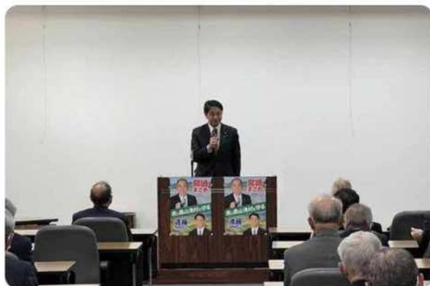
水土里ネット宮田用水