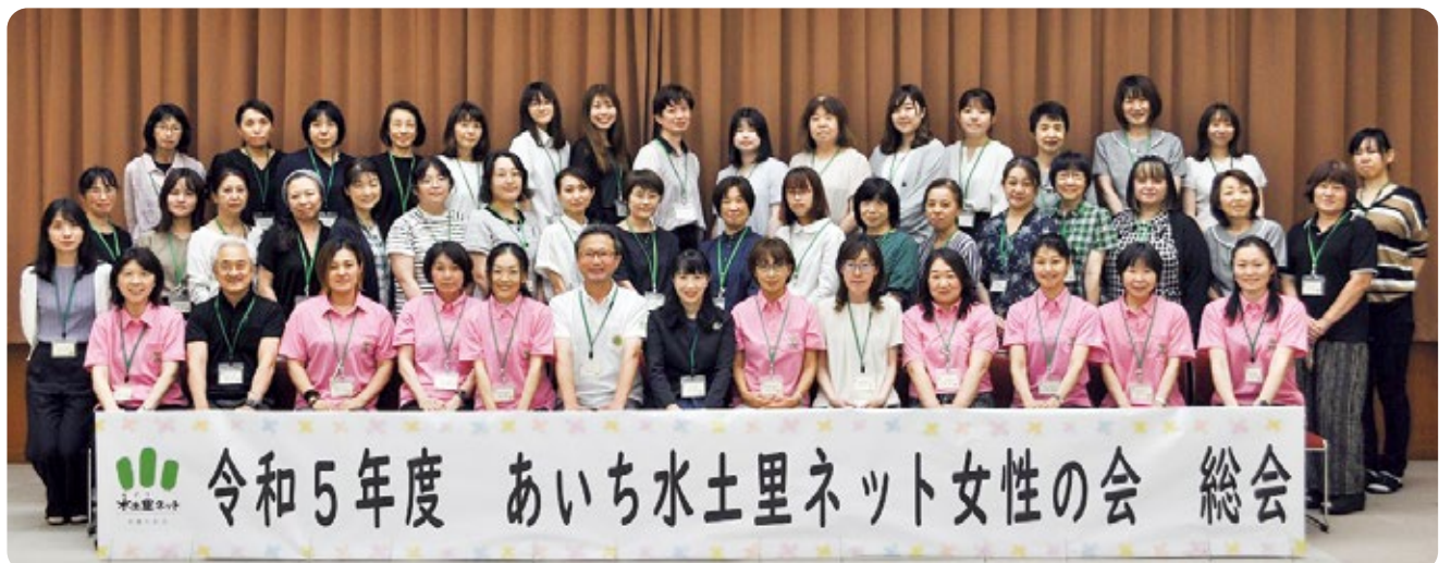
総会出席者集合写真