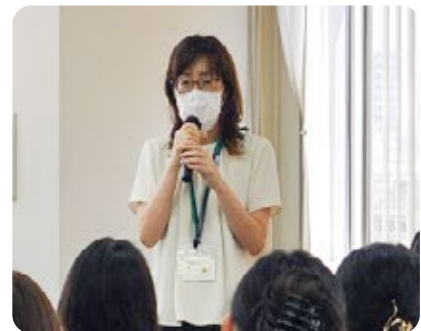
星専門技術指導官による挨拶