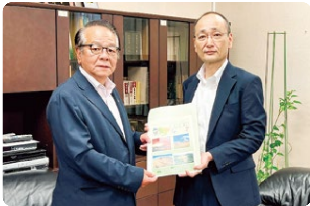
安部農村振興局次長に要請書を手交

振興局幹部職員への要請活動を実施した。また、関係の国会議員に対しても要請活動を行った。