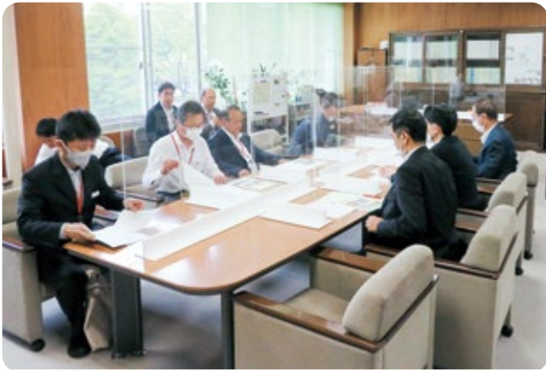
東海農政局幹部への要請