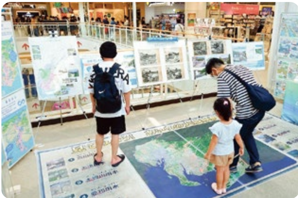
大規模農業用水マットの設置