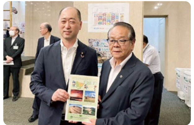
宮崎雅夫参議院議員に要請書を手交