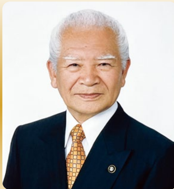
長瀬 保様 前北名古屋市長(元本会理事)