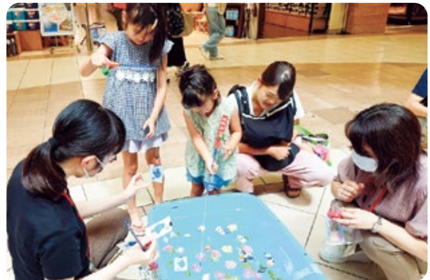
用水のいきものカード釣り