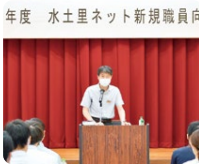
永田農地計画課長補佐による講義