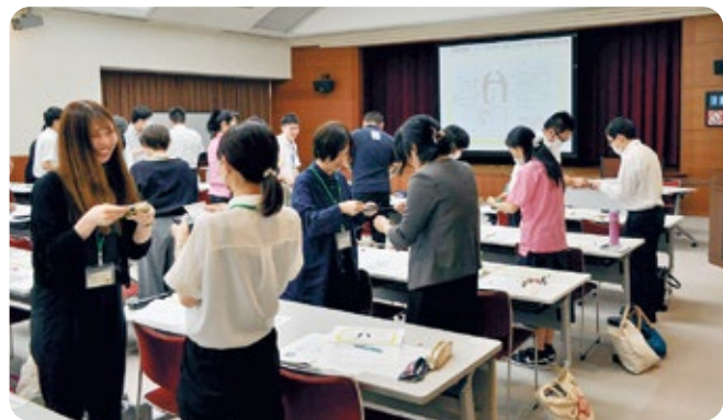
ビジネスマナー研修の様子