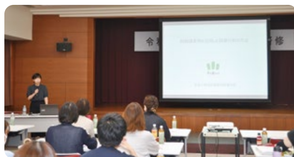
全国水土里ネット 前角主事による講義