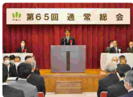
大村愛知県知事による来賓祝辞