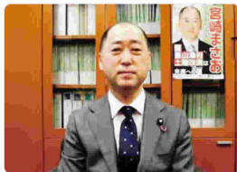
宮崎雅夫参議院議員より寄せられたビデオメッセージ