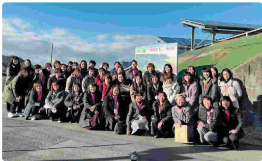
発電所前にて集合写真