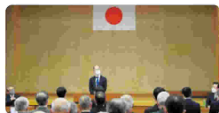
水土里ネット海部