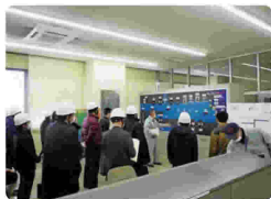
日光川排水機場視察

向上及び管理意識の高揚を図るために開催するもので、市町村・水土里ネット等の役職員や運転管理者43名が参加した。