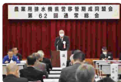
議長を務める平野会長

続いて議事に入り、令和3年度事業報告・同収支決算承認、令和5年度事業計画・同会費の徴収基準・同収支予算について審議し、原案どおり可決承認された。