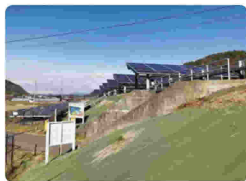
芥見大船太陽光発電所視察

この研修会は、土地改良施設の適切な維持管理と適正化事業の円滑な推進を図ることを目的に毎年実施しているもので、市町村・水土里ネットの職員34名が参加した。