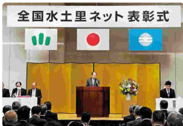
二階俊博全土連会長によるあいさつ