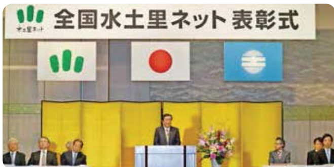
森山農林水産大臣挨拶