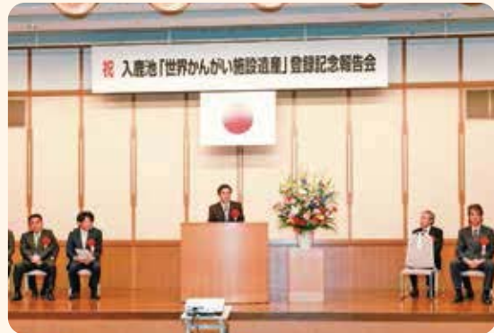
大村愛知県知事による祝辞