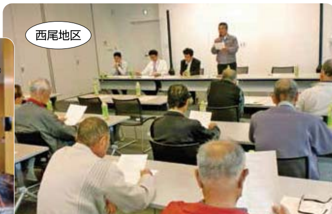
説明を行う石川事業部次長