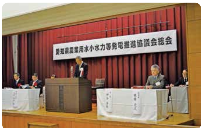
神谷会長による主催者挨拶