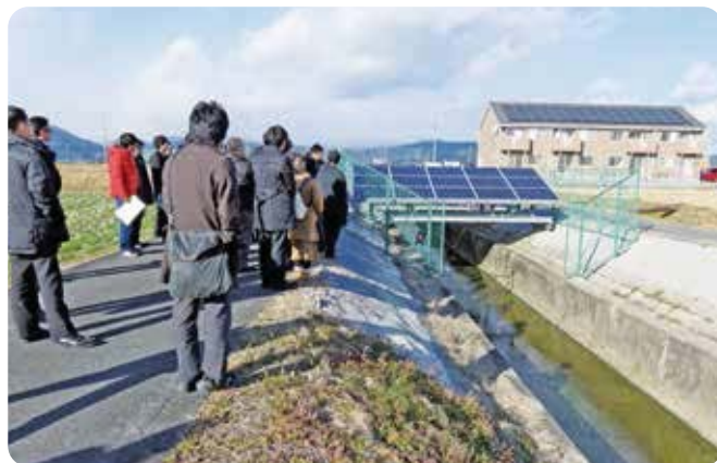
本郷地区太陽光発電所

この研修会は、土地改良施設の適切な維持管理と適正化事業の円滑な推進を図ることを目的に毎年実施しているもので、参加者は、市町村・水土里ネットの職員42名。