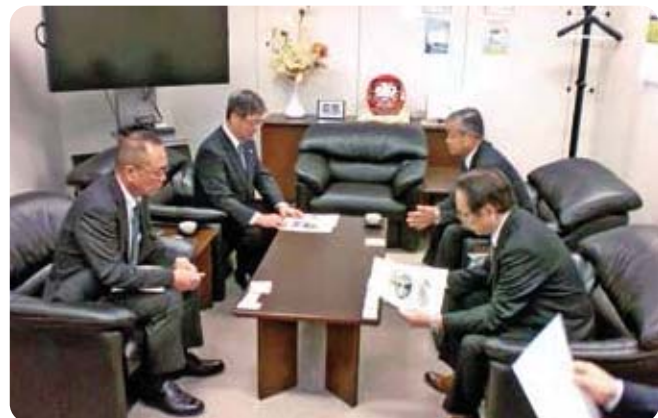
要望説明する白木会長職務代理者