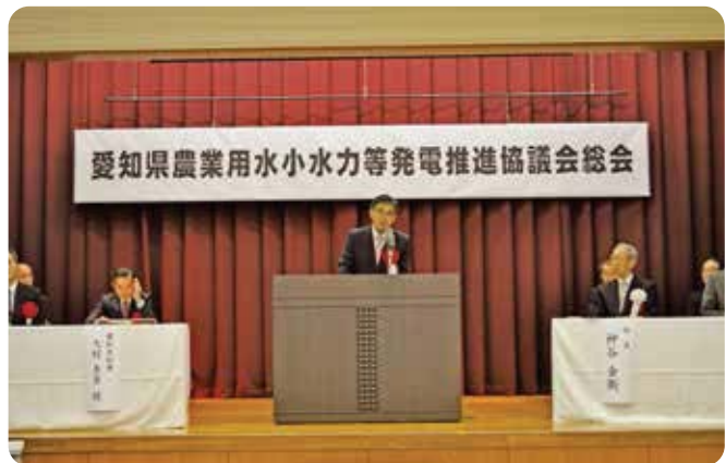
大村愛知県知事による祝辞