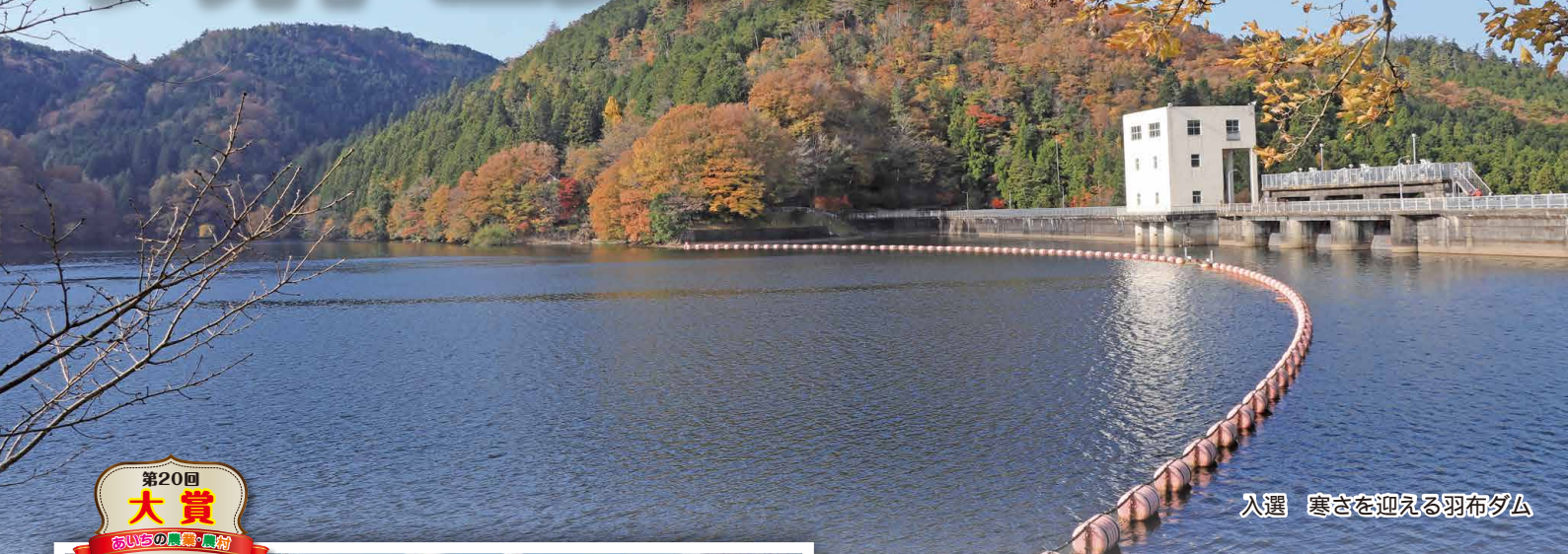
入選 寒さを迎える羽布ダム